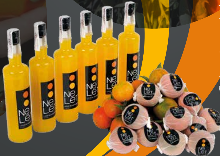
Caja 2 Botellas Licor Nelet*

Combinaciones Botellas Licor Nelet & Naranjas*